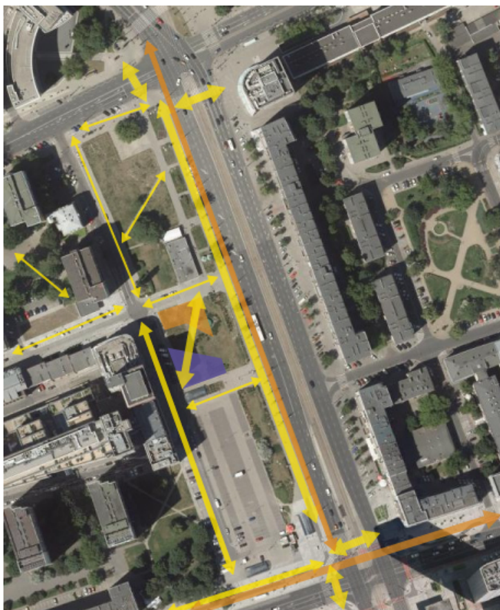
Rys. 3 Mapa terenu Skweru

Przedpołudniem i wczesnym popołudniem skwer jest bardzo dobrze oświetlony. Po południu, prawie każdy fragment skweru przez jakiś czas znajduje się w cieniu, w zależności od drogi słońca za zabudowaniami przy Zielnej. Zaznaczony na Rysunku 3 na fioletowo teren jest ocieniony najdłużej – dosyć szybko zostaje zasłonięty przez budynek PASTy, a potem także przez budynek Bank of China, kiedy słońce, przed schowaniem się za blok przy Zielnej 45, oświetla większość Skweru przez ulicę Próżną. (Oznaczenie ma charakter wyłącznie orientacyjny, nie wynika z całorocznego pomiaru. Obserwacji dokonano na początku czerwca, więc kiedy dzień jest prawie najdłuższy w roku).